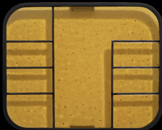
Franck Scurti, Lux , 2024. Technique mixte sur toile; dim : 110 x 130cm

1964 : Une Longue Amitié retrace les richesses des échanges artistiques qui ont façonné l'histoire des relations sino-françaises, en célébrant une union entre tradition et modernité, héritage et innovation